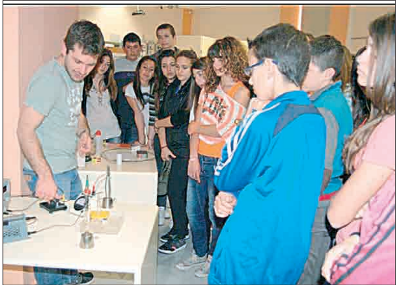
Από την ξενάγηση των μαθητών στα Εργαστήρια του Πανεπιστημίου Πατρών.

Επίσης, συμμετείχαν σε δραστηριότητα για την Ιστορική εξέλιξη των Τηλεπικοινωνιών , ενημερώθηκαν για τις Αρχές της Φυσικής οι οποίες και αποτέλεσαν τη βάση για την εξέλιξη των Τηλεπικοινωνιών και έλαβαν μέρος σε πειραματικές διαδικασίες στις θεματικές ενότητες