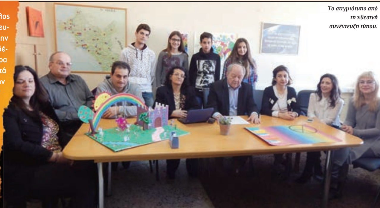
Το στιγμιότυπο από τη χθεσινή συνέντευξη τύπου.

Γνωρίζατε ότι ο εγκέφαλος έχει τρισεκατομμύρια νευρικά κύτταρα και δέκα στην τετράκις εκατομμύρια συνδέσεις, όσα δηλαδή είναι τα άστρα του γαλαξία; Αν όχι, τότε, αυτά και άλλα πολλά θα έχετε την ευκαιρία να μάθετε, στην άκρως ενδιαφέρουσα σχολική ημερίδα με θέμα «Εγκέφαλος... ο Γνωστός Άγνωστος» που θα πραγματοποιηθεί το Σάββατο στις 10 το πρωί, στο συνεδριακό κέντρο της Περιφερειακής Ενότητας Ηλείας (Διοικητήριο) στον Πύργο.