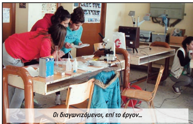
Οι διαγωνιζόμενοι, επί το έργον...